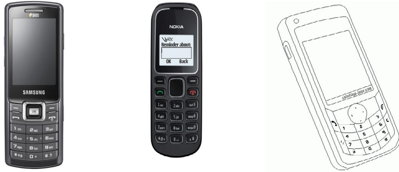
شكل (٢) نماذج لهواتف محمول عادية

الهاتف المحمول لتعليم وتحفيظ القرآن الكريم (بين المستخدم والمدرّب أو المختص) ولا بد من تصميم وإعداد الطريقة الدراسية المناسبة خاصة عند الحفظ.